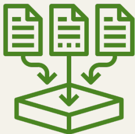
Система централизованного сбора